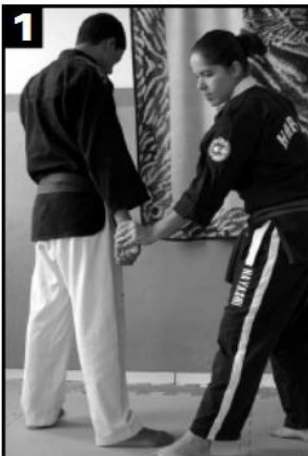
1 Pegada na mão de cima para baixo. O pé avança no mesmo momento da mão.