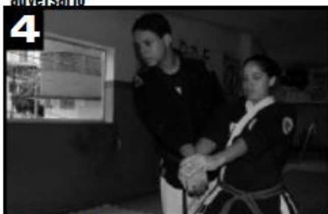
Giro do corpo.