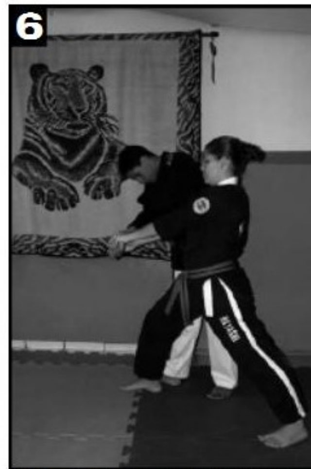
Giro do corpo acompanhado da torção no punho. Adversário avança em relação a postura inicial e prepara-se para executar o movimento de queda