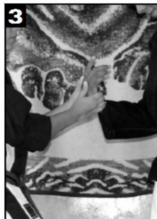
Detalhe da torção no movimento 2.