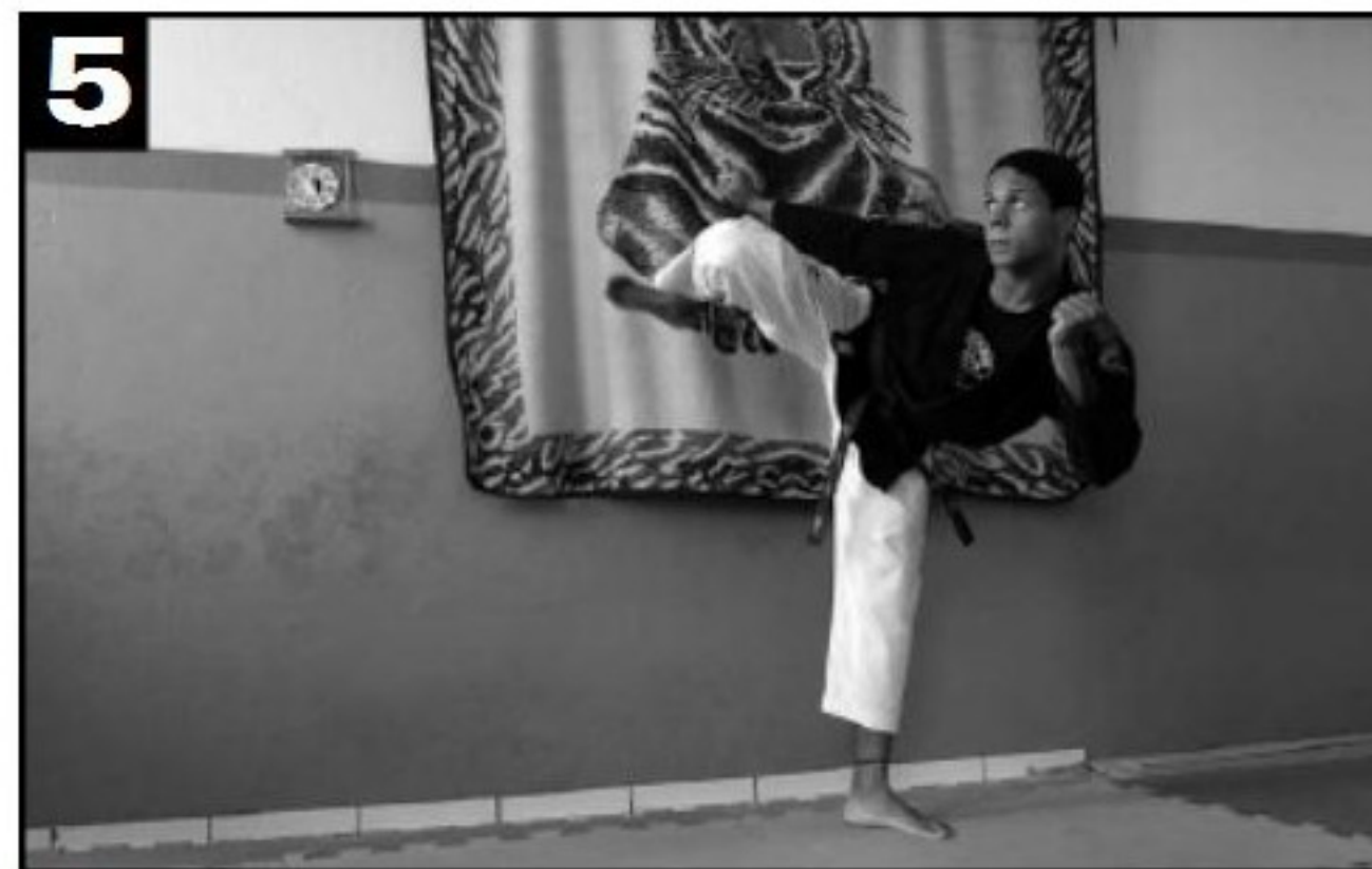
Recolhe-se a perna.