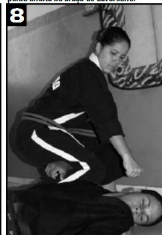
8 Aplicação do soco na altura do rosto do adversário.