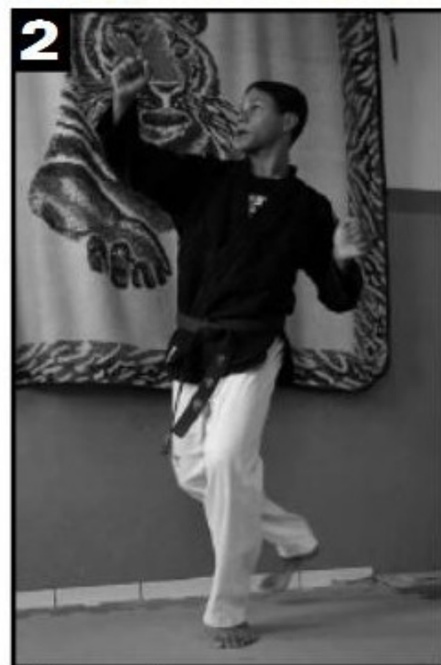
Inicia-se o movimento.