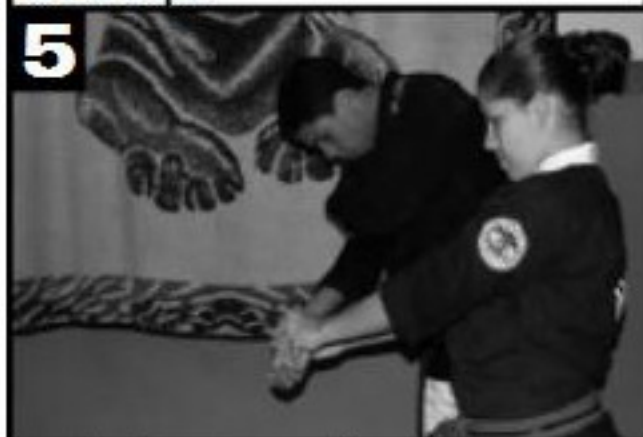
Detalhe do movimento: Giro do corpo acompanhado da torção no punho. Adversário avança em relação a postura inicial e prepara-se para a queda