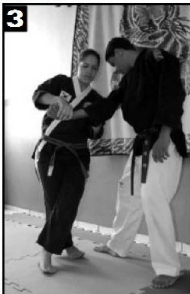
3 Movimento 2 visto de outro ângulo.