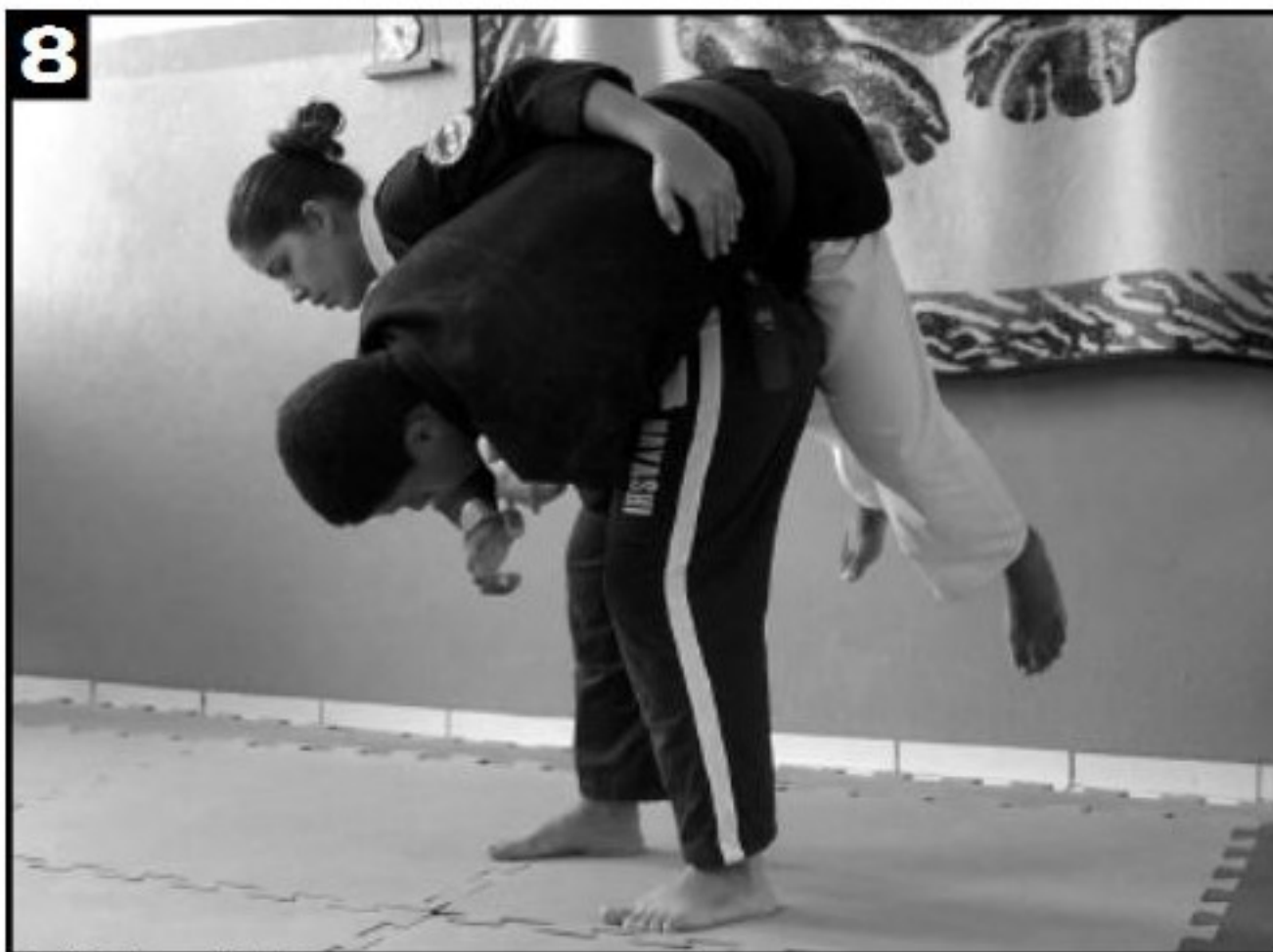
8 Detalhe da queda (1).