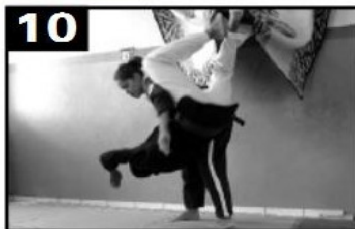
10 Detalhe da queda (3).