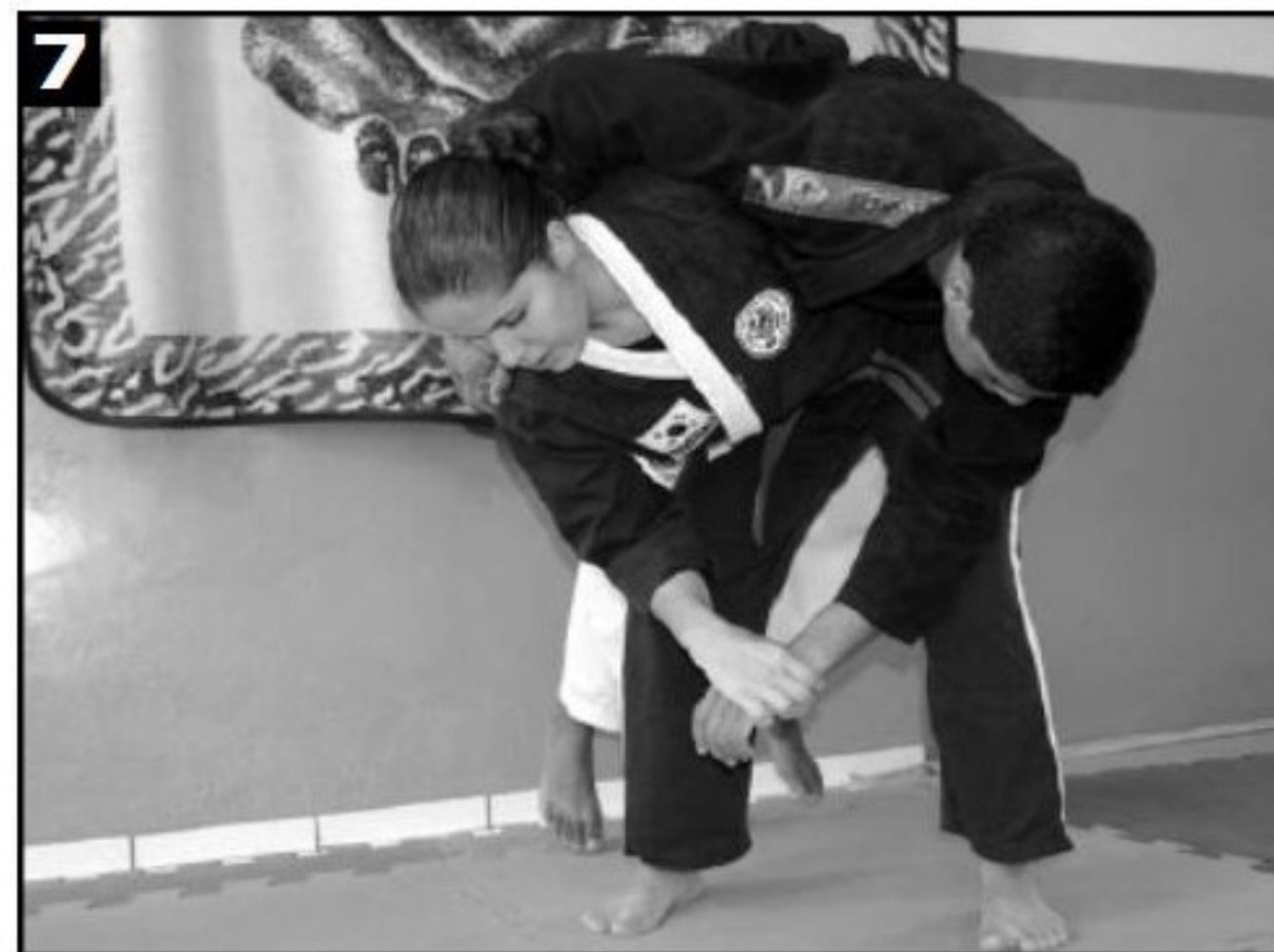
7 Adversário sendo derrubado.