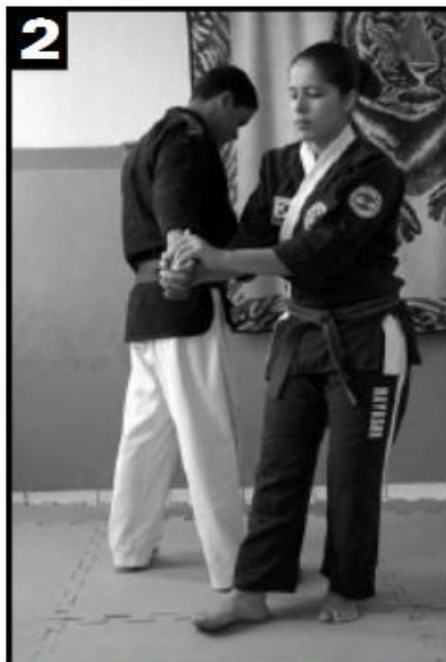
2 Segunda mão avança, reforçando a torção. O segundo pé também avança.