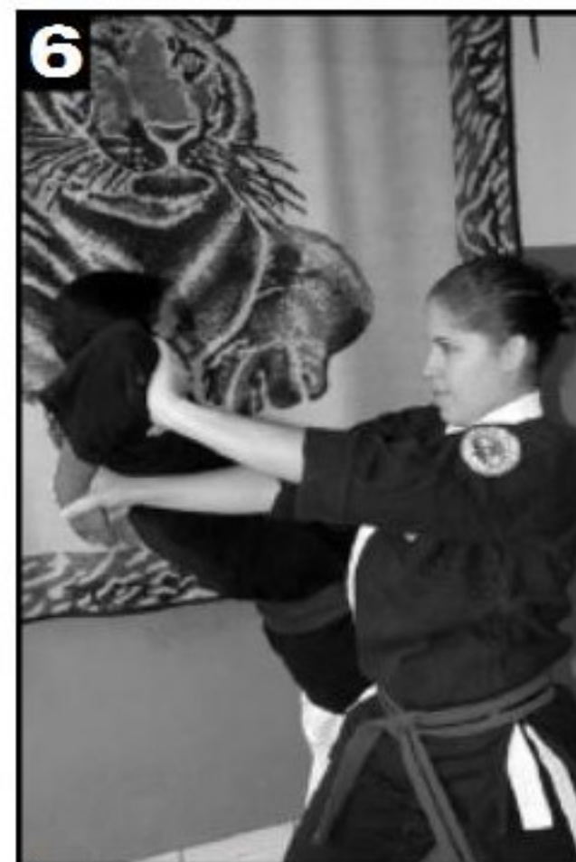
6 Torção sendo aplicada e o adversário preparando-se para executar a queda.