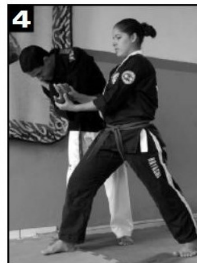
A perna de trás irá executar um movimento de giro.