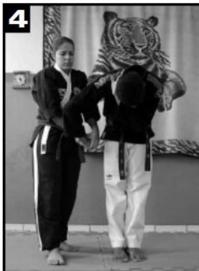
4 A mão do adversário é puxada para trás do seu corpo. Ele se prepara para executar a queda.