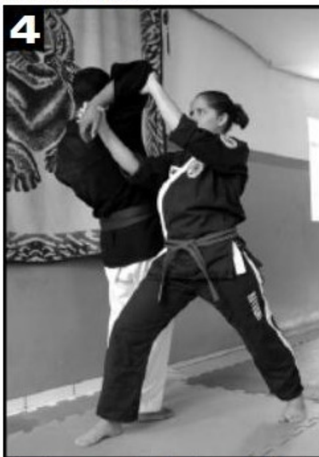
4 Giro do corpo seguido da aplicação da torção, de forma a fazer uma alavanca com o braço do adversário.