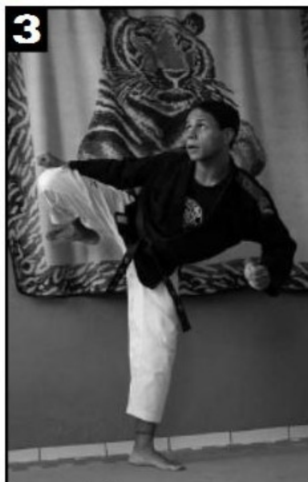
Ergue-se o joelho.