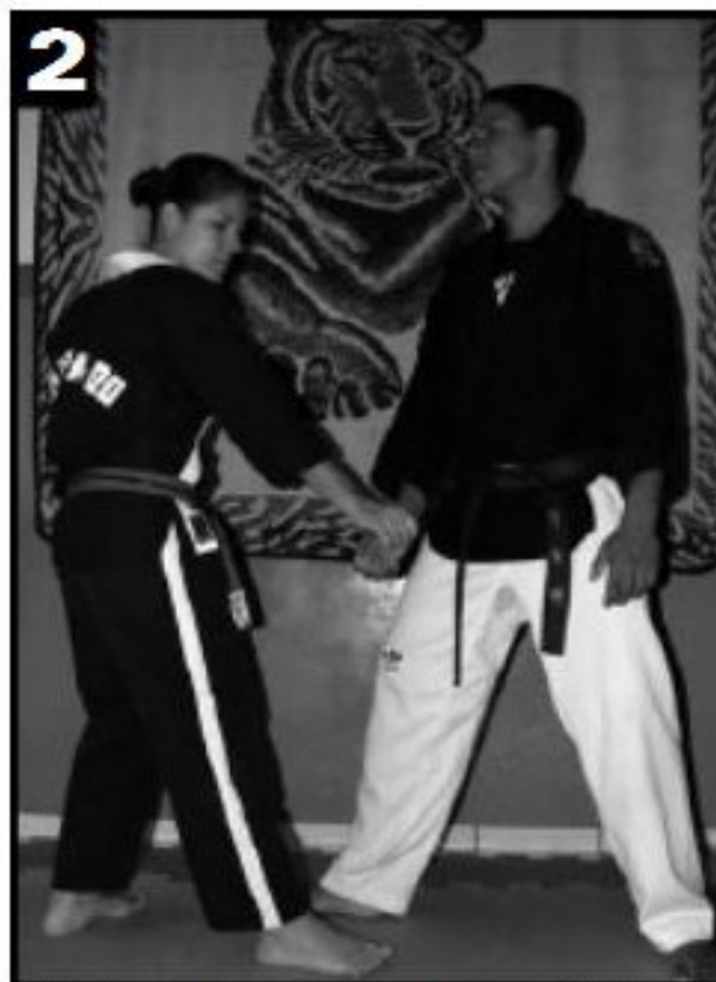
Pegada na mão por cima, acompanhada pelo avanço do pé que encontra-se paralelo ao do adversário