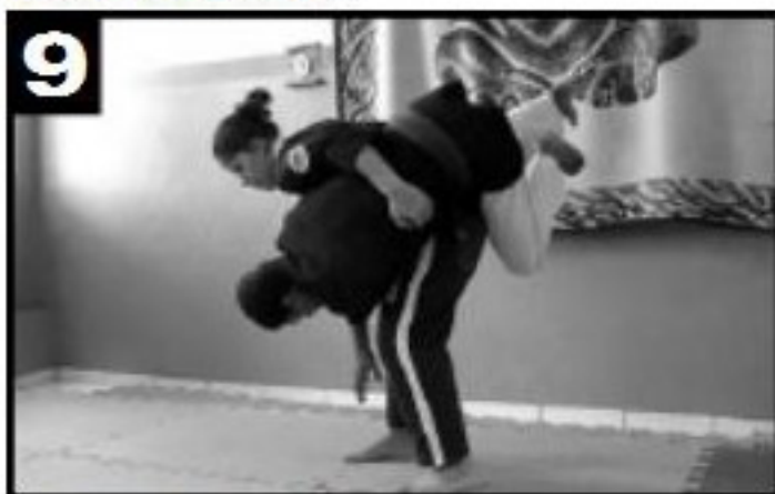
9 Detalhe da queda (2).