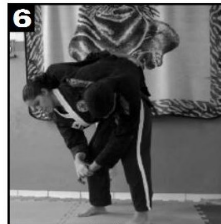
5 Ergue-se o adversário de forma que ele passe por cima da faixa do executor do movimento.