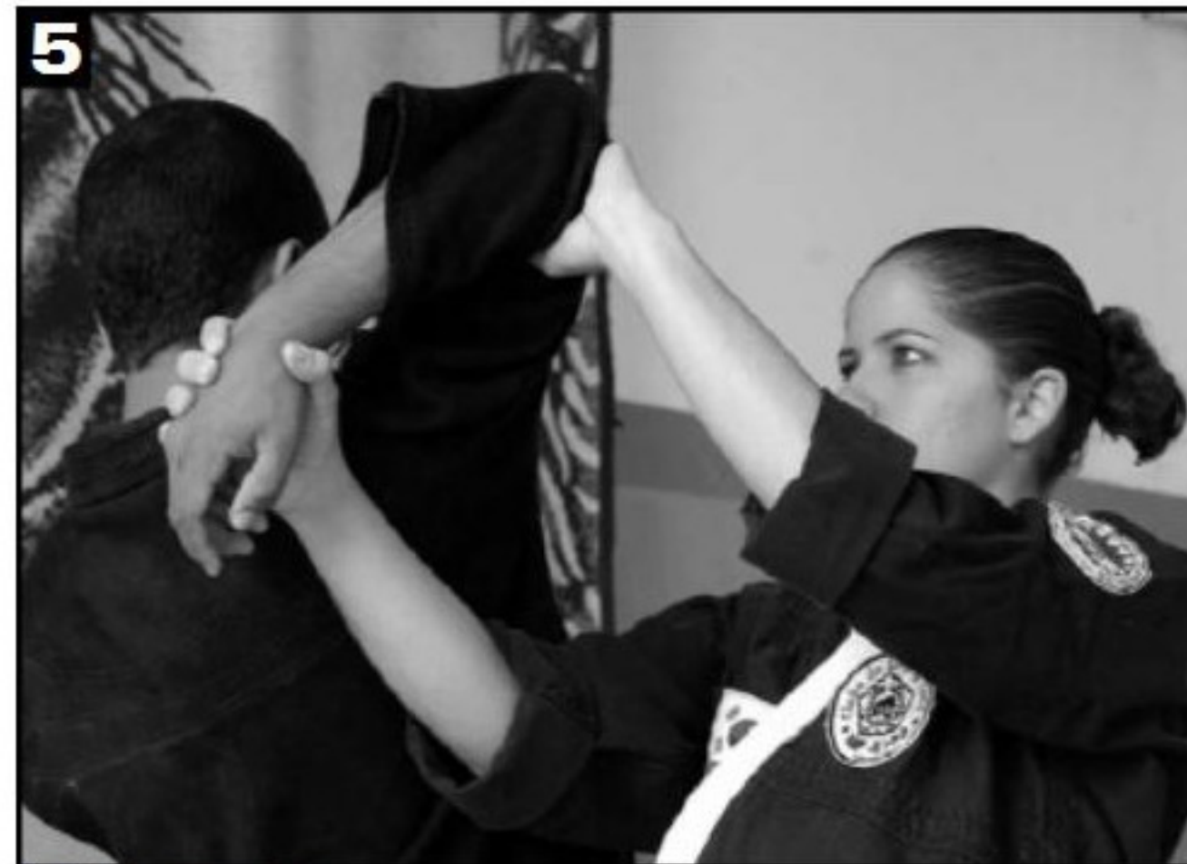
5 Detalhe do movimento 3.