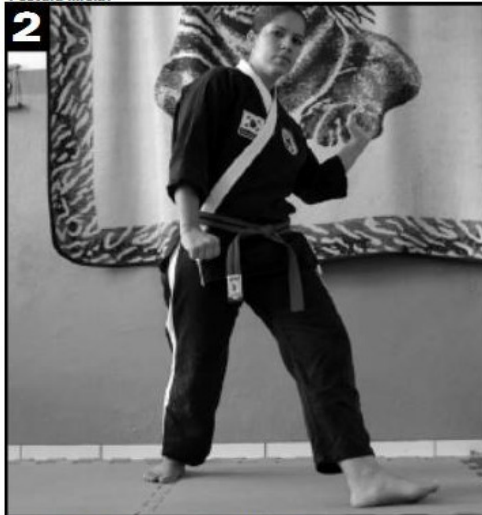
Gira-se o pé da frente com o calcanhar fixo no solo.