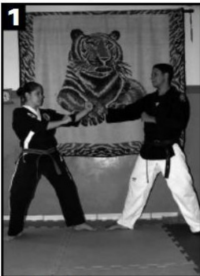
Postura de combate.