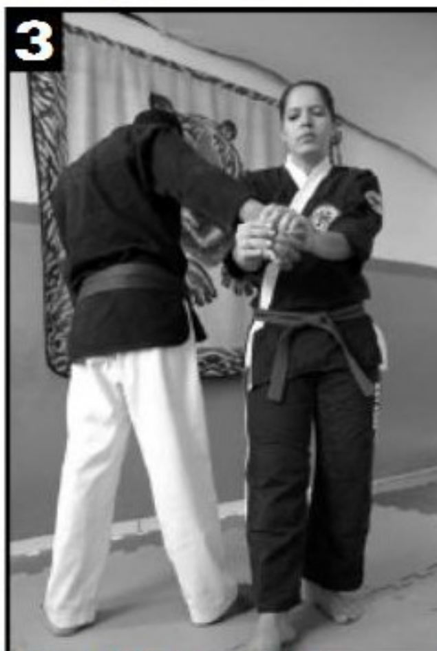
3 Movimento 2 visto de outro ângulo.