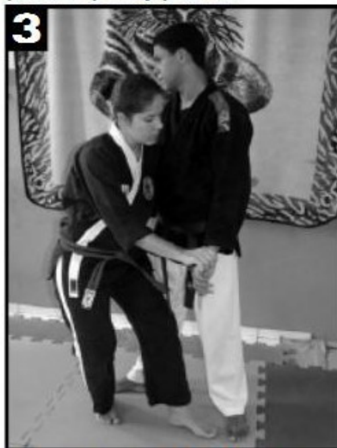
3 O pé esquerdo avança e a mão esquerda coloca-se de forma a abraçar o adversário, na altura de sua faixa.