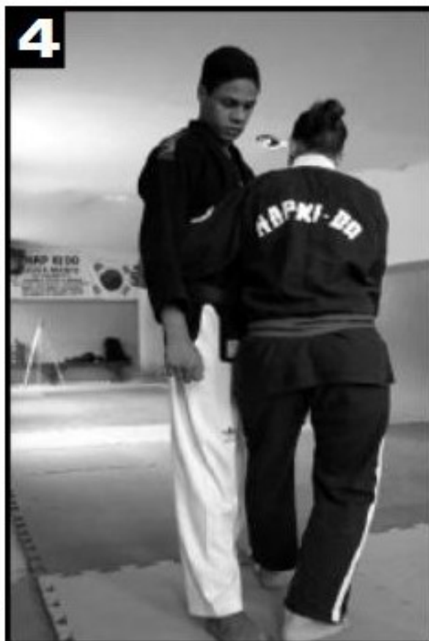
4 Movimento 2 visto de outro ângulo.