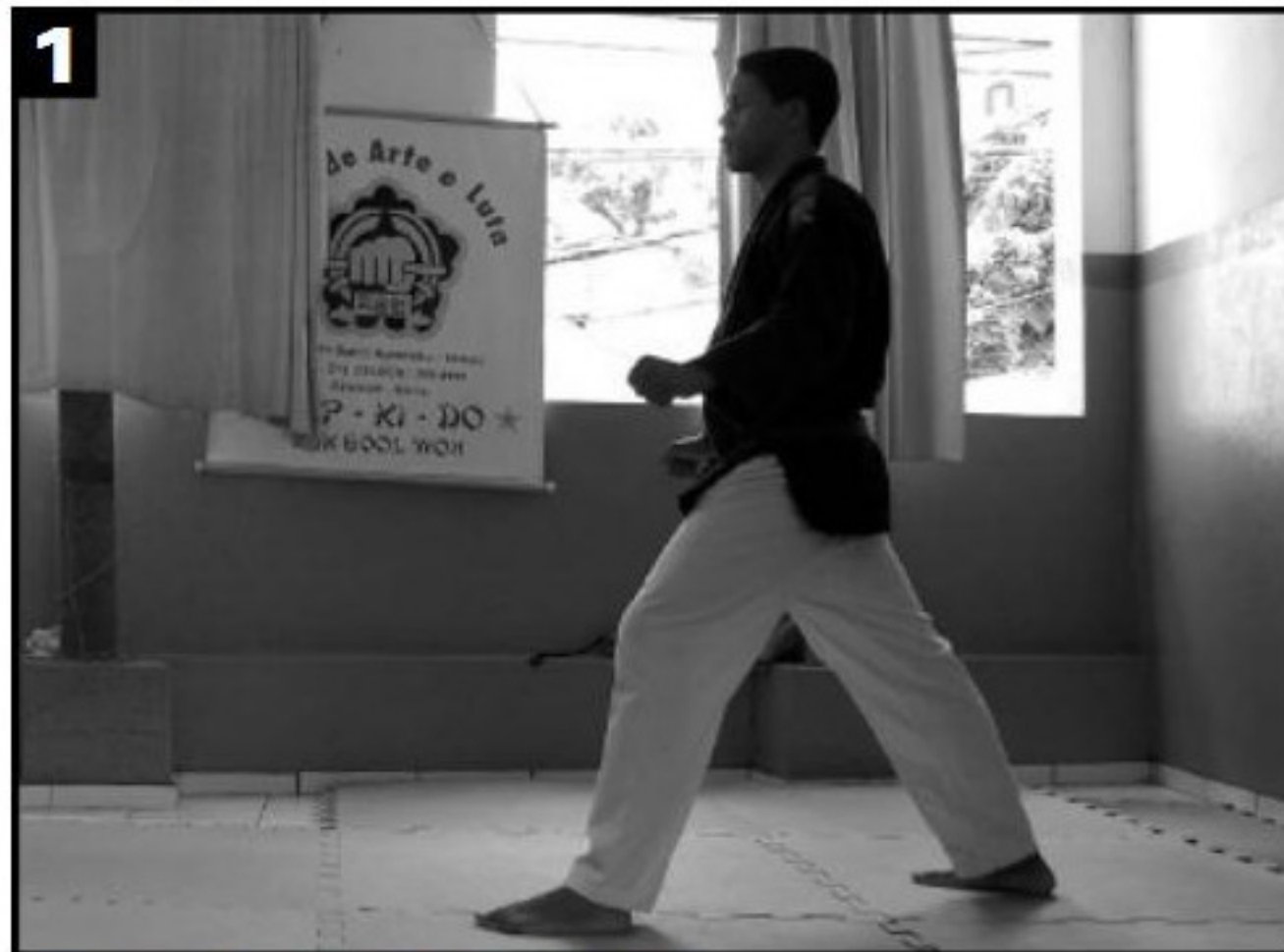
Postura Inicial - pontapé lateral com o peito do pé.