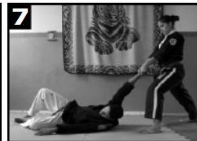
Projeção do adversário.