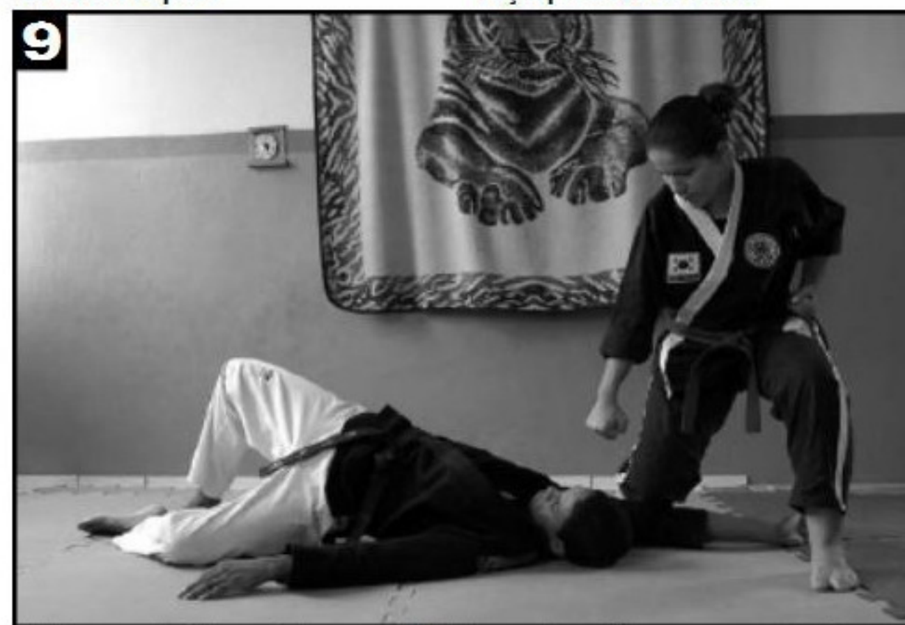
Movimento 6: ajoelha-se sobre o cotovelo do adversário e aplica um soco na altura do rosto.