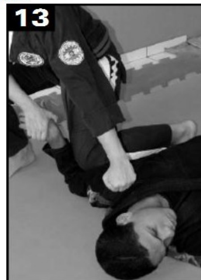
13 Movimento 5: detalhe da torção e do soco.