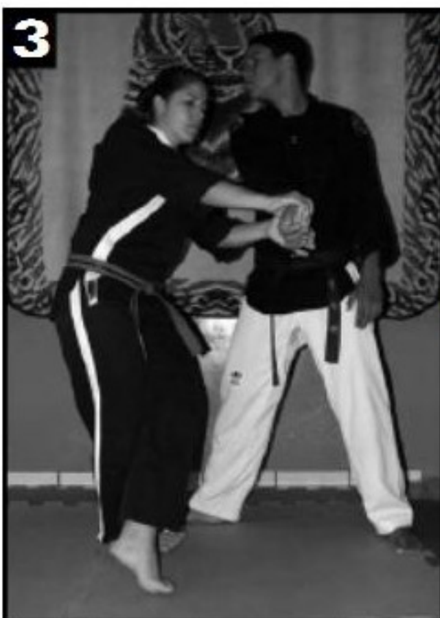
Entrada da segunda mão, acompanhada pelo avanço do segundo pé, começando o movimento de giro..