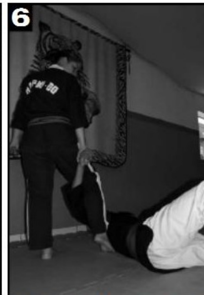
6 Inicia-se a aplicação de uma torção, com a perna direita no braço do adversário.