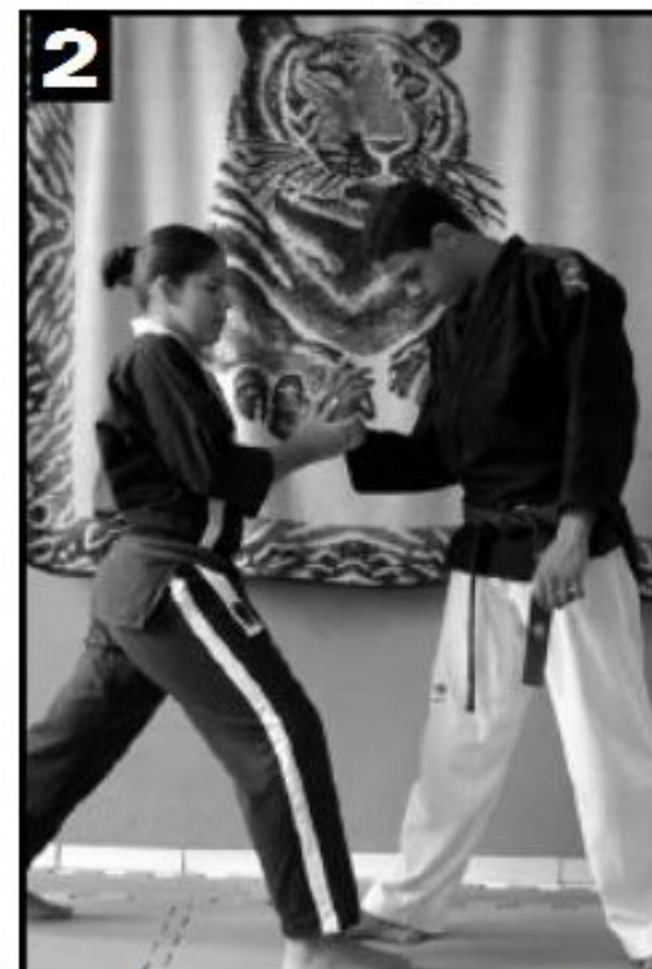
Segunda mão avança, reforçando a torção.