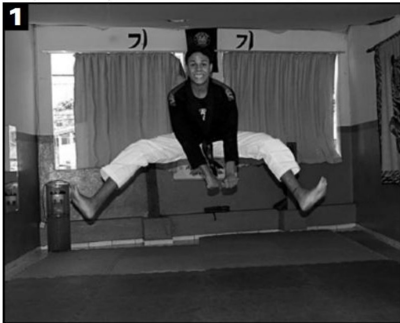
Pontape com os dois pés