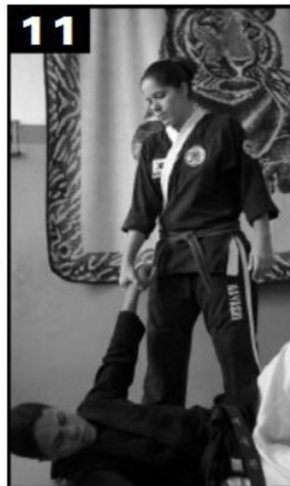
11 Detalhe da queda (4).