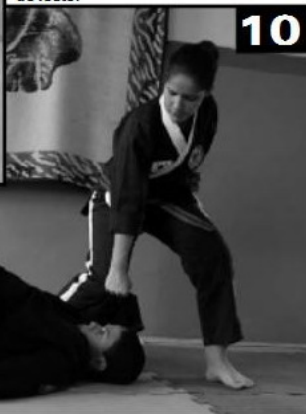
Ajoelha-se em cima do braço do adversário e aplica-se um soco na altura do rosto.