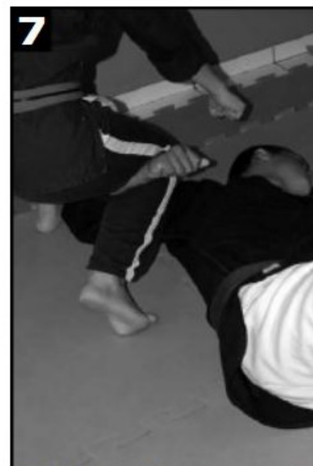
7 Detalhe da torção. Vale ressaltar, que o adversário não conseguirá abrir a mão direita.