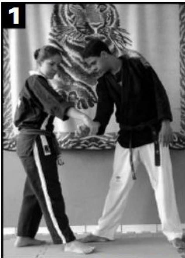
1 Pegada na mão por baixo e aplicação da torção. Acompanha avanço do pé, paralelo ao do adversário.