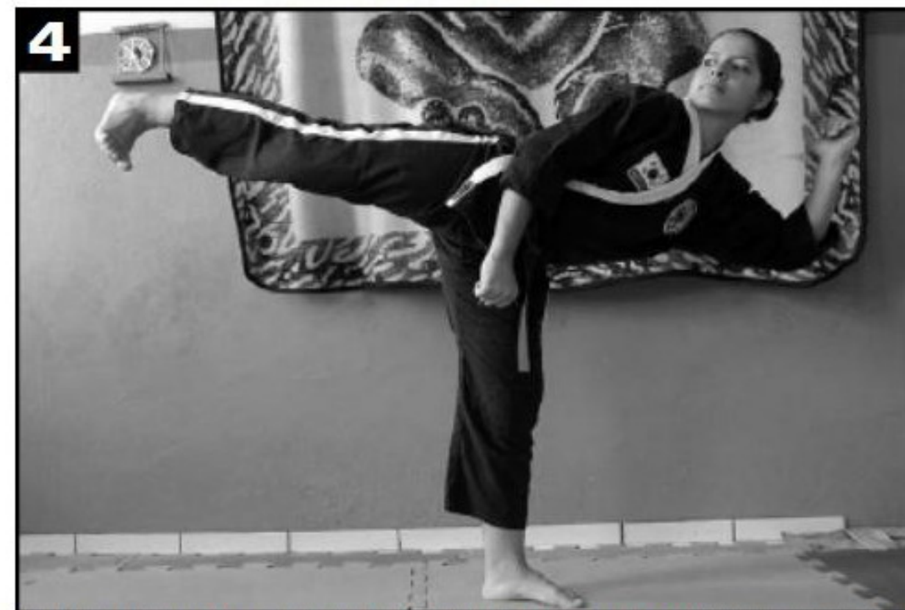
Aplica-se o pontapé com o calcanhar. As pontas dos dedos tem de estar voltadas para baixo.