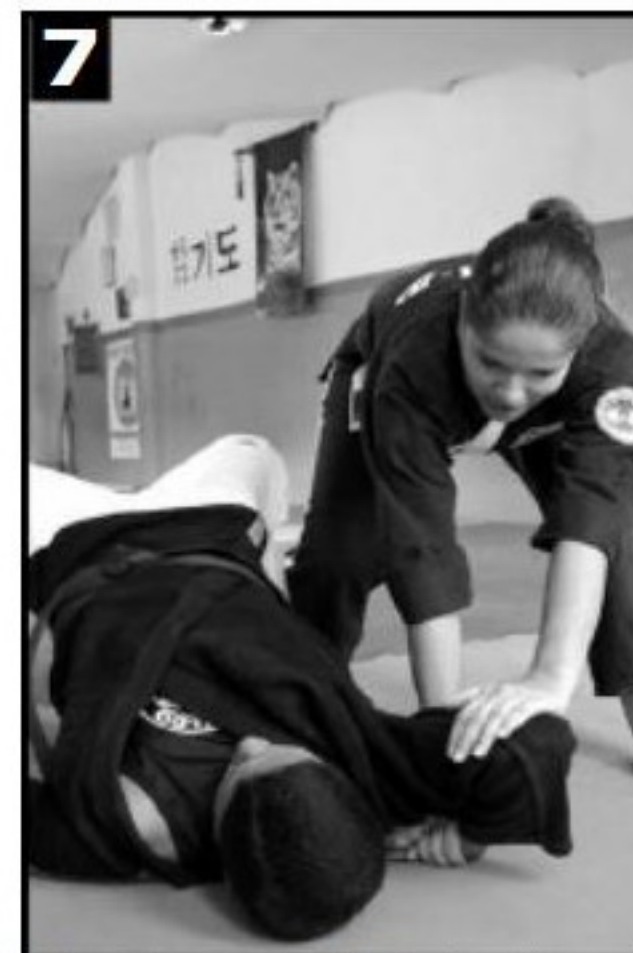
7 Adversário sendo conduzido até o chão.