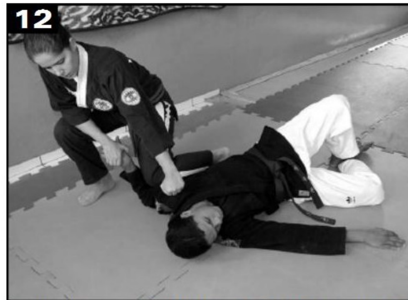
12 Aplica-se uma torção na mão esquerda e ajoelha-se sobre o braço do adversário. Aplica-se um soco na altura do rosto.