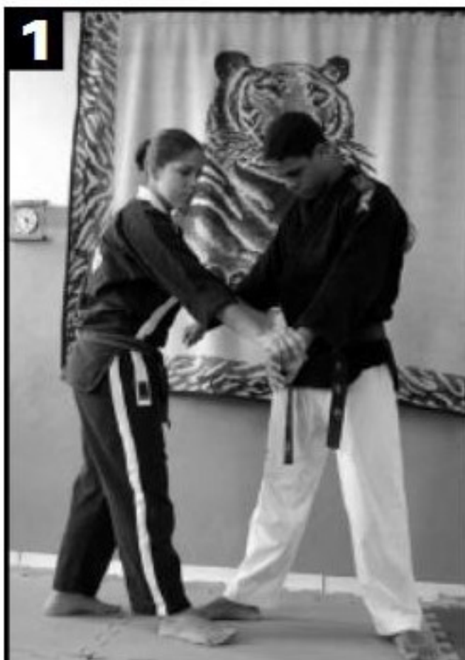
1 Mão esquerda afasta o braço direito do adversário por baixo. Mão direita aplica uma torção de baixo para cima. O pé avança juntamente.