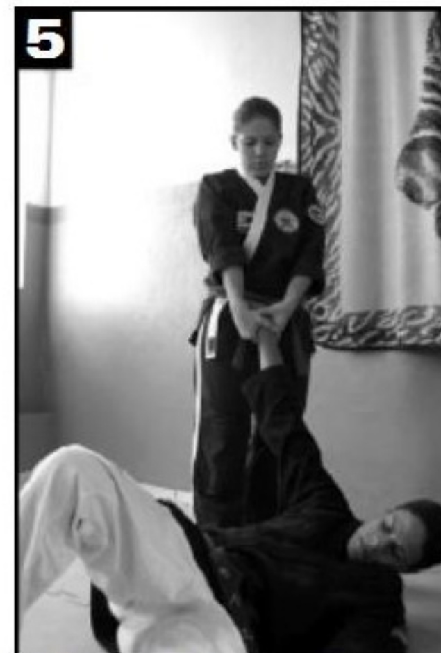
5 O adversário é projetado para o chão.