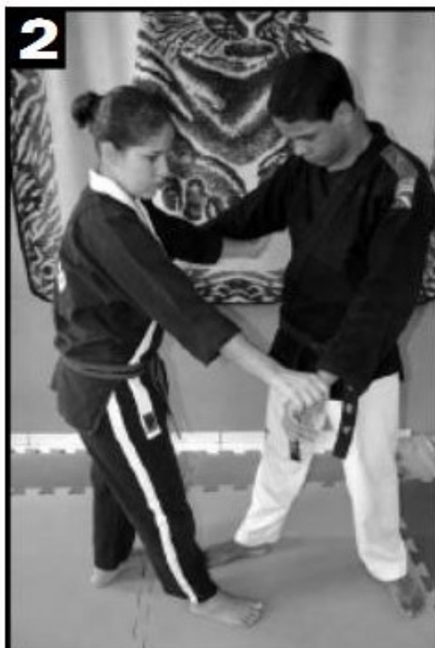
2 Movimento 1 visto de outro ângulo.