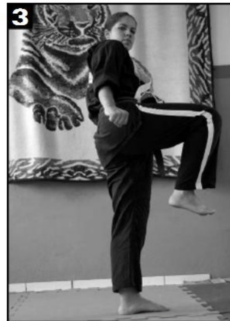
Ergue-se a perna até a altura da cintura.