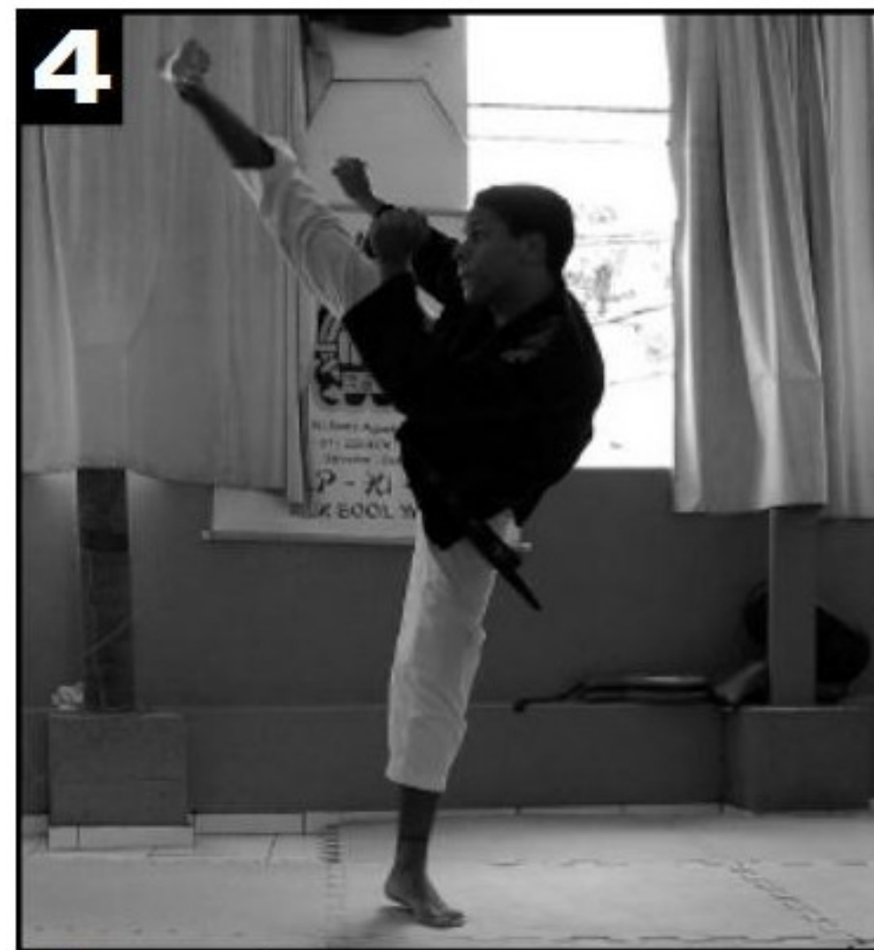
Aplica-se o pontapé.