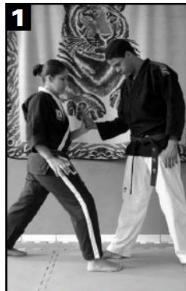
Pegada na mão de baixo para cima. Avanço do pé no mesmo momento, paralelamente ao do adversário.