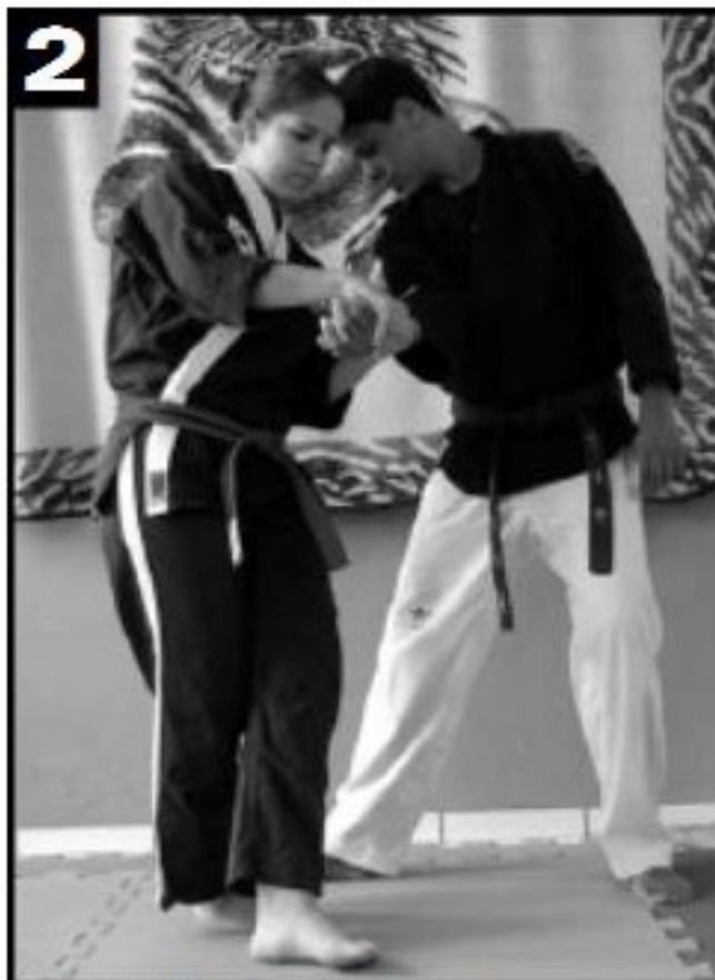
2 Avanço da segunda mão na altura do cotovelo, acompanhado do pé, iniciando o movimento de giro.